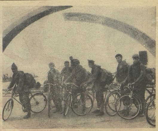
Нужно всё увидеть, нужно всё запомнить. Чтобы после слёта, вернувшись домой, рассказать о том, что повиновалось...

Разлив. Это место знает весь мир. Здесь работал Ленин.